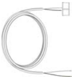
Cordon HP : DIS C10/SVA