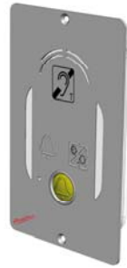
PTU 80V6 014