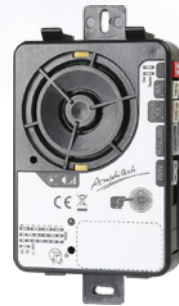
Sistemas de intercomunicación local de maquinaria

Desde hace 30 años y con más de 1.000.000 de telealarmas e intercomunicadores instalados, AMPHITECH propone a sus clientes ascensoristas soluciones innovadoras que cumplen con las normas y reglamentos. La nueva telealarma universal TA80, que cumple con la norma EN 81-28 versión 2018, no es una excepción a esta regla. Diseñado con innovaciones digitales, la TA80 proporciona una mejor protección contra las sobretensiones.