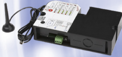
Puerta de enlace/Gateway GSM