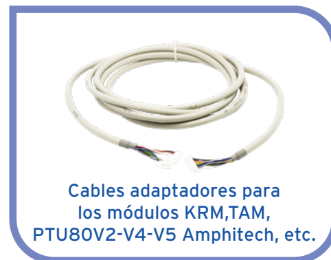
Cables adaptadores para los módulos KRM, TAM, PTU80V2-V4-V5 Amphitech, etc.

Compatible con todos los adaptadores del mercado, comunicación en cabina, debajo de cabina (KRM, TAM, etc.)