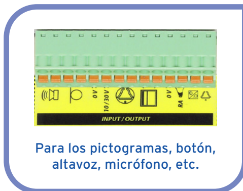
Para los pictogramas, botón, altavoz, micrófono, etc.